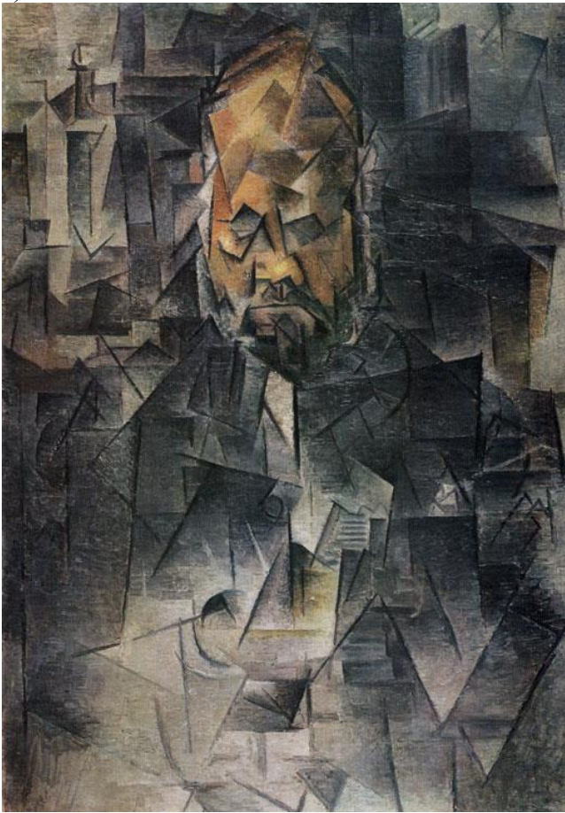
Пабло Пикассо. «Портрет Амбруаза Воллара». 1909-1910.