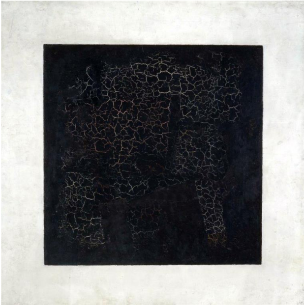
Казимир Северинович Малевич. «Черный супрематический квадрат». 1915.