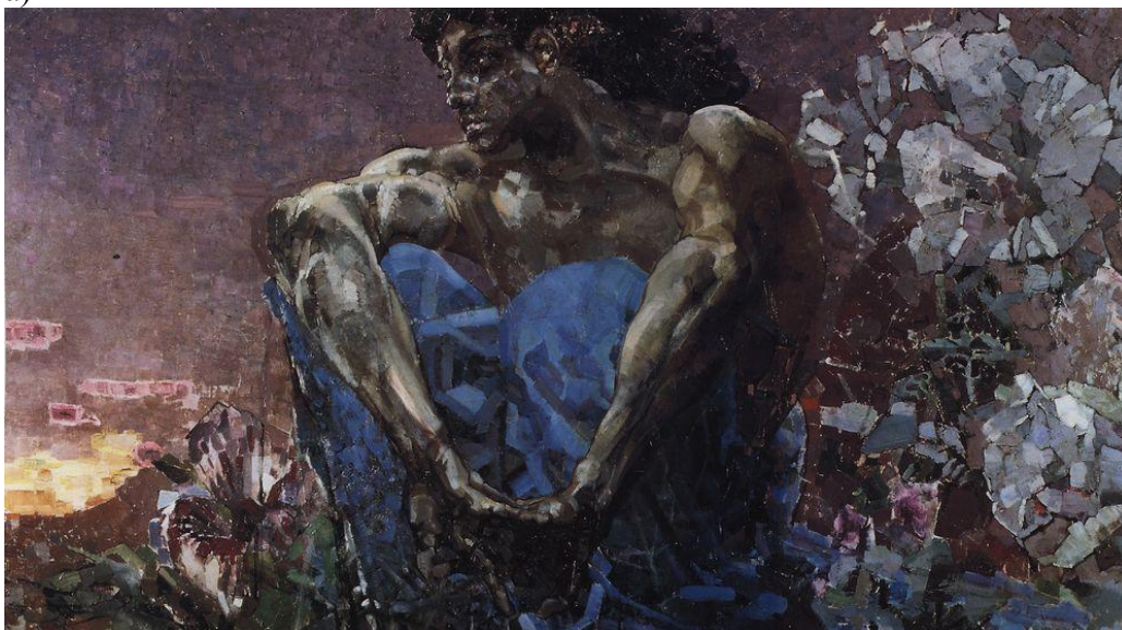
Михаил Александрович Врубель. «Демон сидящий». 1890.