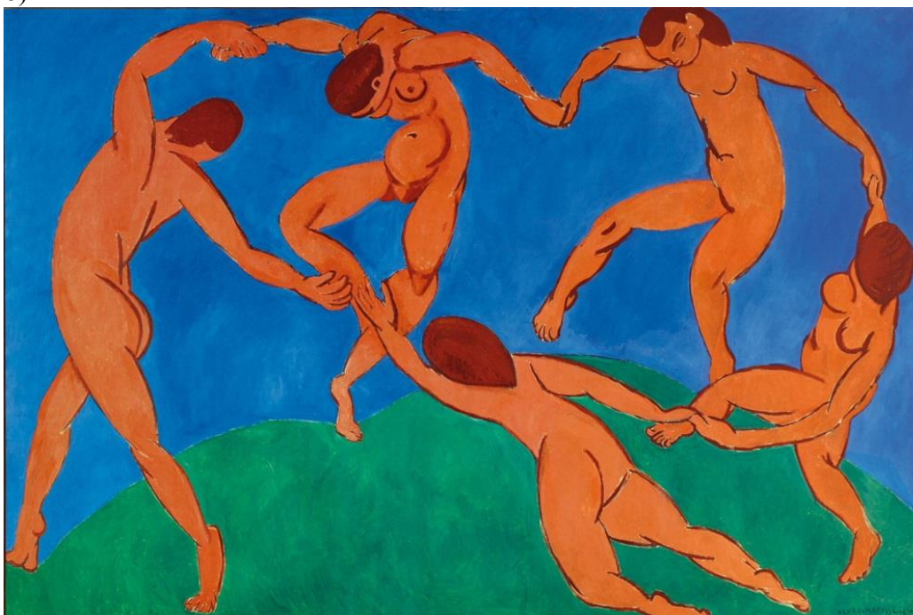
Анри Матисс. «Танец». 1910.